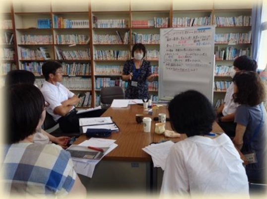
授業者も一緒に入って具体的な姿を出し合う