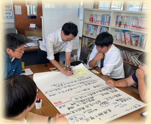
学びを付箋に宣言して自分の授業に活かす

授業を見る視点を共有して、みんなが同じ視点で授業を視るので一人一人の授業研究会への貢献度は高いです。ざっくりとしか授業を見ていないとRound studyでは、貢献ができないので次からは子どもの言動だけでなく表情やつぶやきまでしっかり視ようとする目が育ちます。それらをファシリテーターが引き出します。意見をまとめる必要はありません。自然に子どもの姿から授業の本質へと議論は深まります。最後に今日の授業で学んだこと、明日からの授業に活かすことを付箋に書く場面ではさらに参加者の頭がフル回転しているようです。これまでの授業研究会の仕組みを変えることで、グループで貢献するために授業を視ようとする行動が変わり、自分の授業への意識への変容を期待しています。