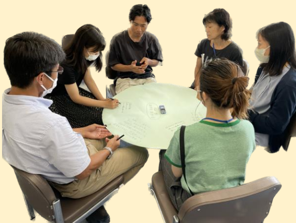
ラウンドミーティングでふりかえりをする参加者